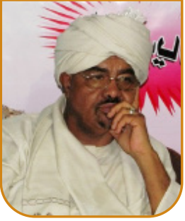
بقلم: كمال حامد